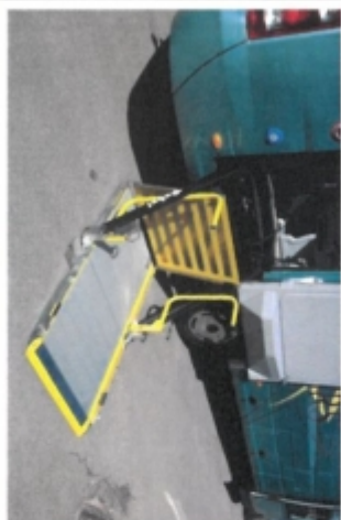
Option plateforme UFR